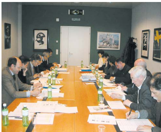
Le Comité directeur du MEMOS El Comité director del MEMOS The MEMOS Steering Committee

T he MEMOS (Executive Masters in Sport Organisations Management) mission is to help professionals working in national or international sports bodies to develop the knowledge required in order to better manage their organisations.