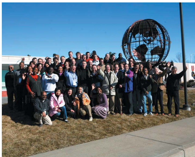
MEMOS X à Colorado Springs (USA) MEMOS X en Colorado Springs, USA MEMOS X in Colorado Springs, USA

T he MEMOS is an executive master which is offered in three editions according to the teaching language: English, French or Spanish. Generic information on each of the three editions is provided below in the respective language. For specific information on the current editions, please refer to the leaflets inserted in the middle of this brochure.